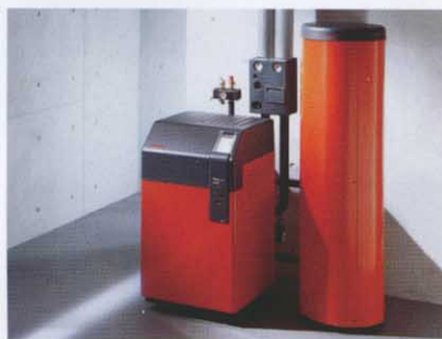
Kompaktheizeinheit Weishaupt Thermo Unit: Für Ein- und Mehrfamilienhäuser.

Für die Beheizung von Ein- und Mehrfamilienhäusern