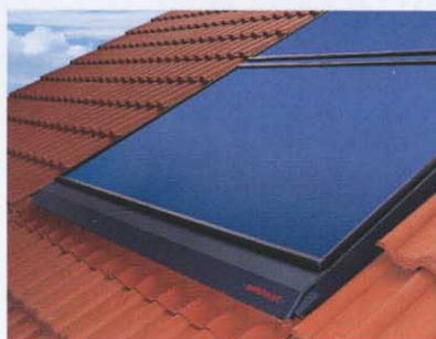
Solar-Systeme Weishaupt Thermo Solar. Gratis-Energie Tag für Tag.