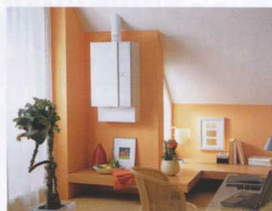
Brennwertgerät Weishaupt Thermo Condens. Das Energiebündel.

Fragen Sie Ihren Heizungsfachbetrieb oder die Weishaupt-Niederlassung Köln, Rudolf-Diesel-Straße 22-24, 50226 Frechen Telefon (0 22 34) 18 47-0, Telefax (0 22 34) 18 47 80, e-mail: nl.koeln@weishaupt.de